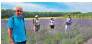
Wie in der Provence: Lavendelfeld der Landesgartenschau

Diese Überschrift trug unsere viertägige Wanderfreizeit, die wir vom 10. bis zum 13. Juli 2023 an der Weser verbrachten. Von unserem Standquartier in einem Hotel in Beverungen ging es zur Landesgartenschau im benachbarten Höxter, zum Schloss und Kloster Corvey, nach Bad Karlshafen, zum Weser-Skywalk bei Würgassen und in die Weserauen.