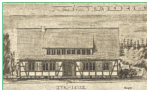
So sollte das SGV-Jugendheim aussehen. Zeitungsfoto

Unter dieser Überschrift informierte die Neheim-Hüstener Rundschau in der Ausgabe vom 18. April 1952 ihre Leser über ein Projekt des Neheimer SGV, ein früher Vorläufer unseres Wanderheims. Wir wissen, dass daraus schließlich doch nichts geworden ist. Die Gründe für das Scheitern sind unbekannt, aber wahrscheinlich war es die Finanzierung der für die damalige Zeit großen Bausumme, die sich nicht realisieren ließ. Man erhoffte sich nicht nur Unterstützung durch die Stadt, sondern auch Zuschüsse des Landes. Entstehen sollte der Fachwerkbau auf einem Grundstück im Rumbecker Holz, weil – wie es in dem Bericht heißt – „die Jugend heute unbedingt von den Straßen und Gassen in eine Gemeinschaft guter Menschen zurückgeholt werden muss“.