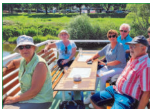
Auch eine Schifffahrt auf der Weser gehörte zum Programm.