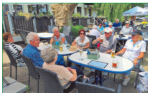
Ein gemütlicher Biergarten an der Weserfähre in Wehrden lud zu einer Rast auf dem Weserhöhenweg ein.