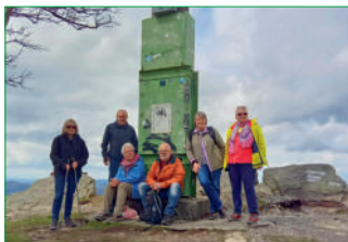
Das Gipfelkreuz des 703 Meter hohen Olsbergs bei dem gleichnamigen Ort im Ruhrtal war Ziel einer Wanderung am 23. April 2023.