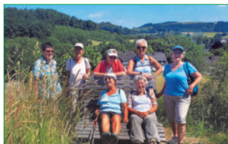
„kug“-Wanderung am 13. Juni 2023 bei Wenholthausen

Die leichten bis mittelschweren Wanderungen eignen sich besonders für Wanderanfänger und weniger geübte Personen. Informationen dazu bei Gisela Rose, ☎ 26427, oder Beate Wojtyniak, ☎ 429919.