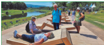
Der Platz an der Sonne: Ausruhen am Weserufer