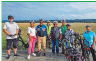
Mittwochabendradeln am 16. August 2023 bei Günne