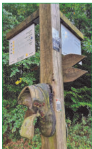
Wegezeichen am Stemeler Rundweg

Die Teilnahme an unseren Wanderungen erfolgt auf eigene Gefahr und ist für SGV-Mitglieder kostenlos. Gäste können unsere Veranstaltungen zum Kennenlernen unverbindlich und unentgeltlich besuchen. Sie melden sich dafür bei dem jeweiligen Wanderführer bzw. Veranstaltungsleiter an. Das in diesem Wanderplan veröffentlichte Programm ist ein vorläufiges. Im Laufe des Jahres können aus unterschiedlichen Gründen Änderungen eintreten, Veranstaltungen ausfallen, hinzukommen oder auf andere Tage verlegt werden. Jegliche Haftung dafür wird ausgeschlossen. Aktuelle Hinweise finden sich in den lokalen Tageszeitungen und Anzeigenblättern sowie im Internet unter der Adresse