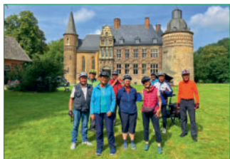
Auf der Fahrradtour „Störche an Ahse und Lippe“ am 3. September 2023 wurde am Wasserschloss Haus Assen ein Fotostopp eingelegt.