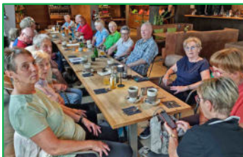
Einkehr zum Abschluss der „kug“-Wanderung am 2. September 2025

Informationen dazu bei Gisela Rose, ☎ 26427, oder Beate Wojtyniak, ☎ 429919.