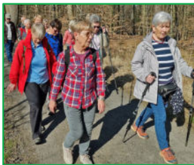
Im Neheimer Stadtwald am 9. März 2025