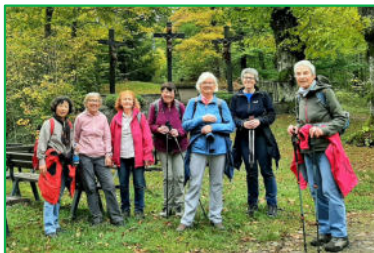
Über den Wilzenberg bei Grafschaft ging es am 12. Oktober 2025.