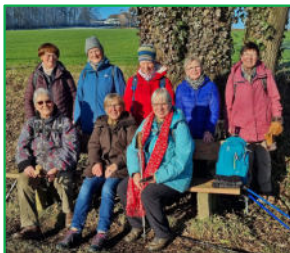
Herrliches Wetter bei Wickede (Ruhr) am 19. Januar 2025