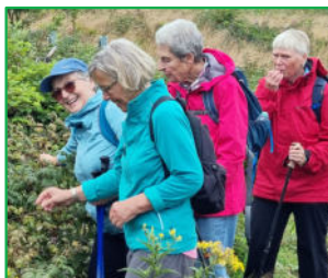
Leckere Beeren bei Hilchenbach am 3. August 2025