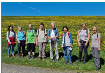
Auf der Nordroute des Reister Kapellenwegs am 27. April 2025