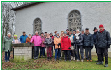
Jahresabschlusswanderung am 29. Dezember 2024 an der Wiedenberglkapelle