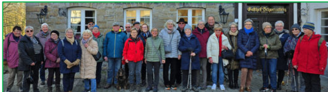
Grünkohlwanderung am 23. November 2025